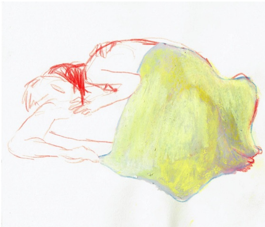
Abb.: Pia von Reis, o.T. (Decke), 21 x 18 cm, 2018.