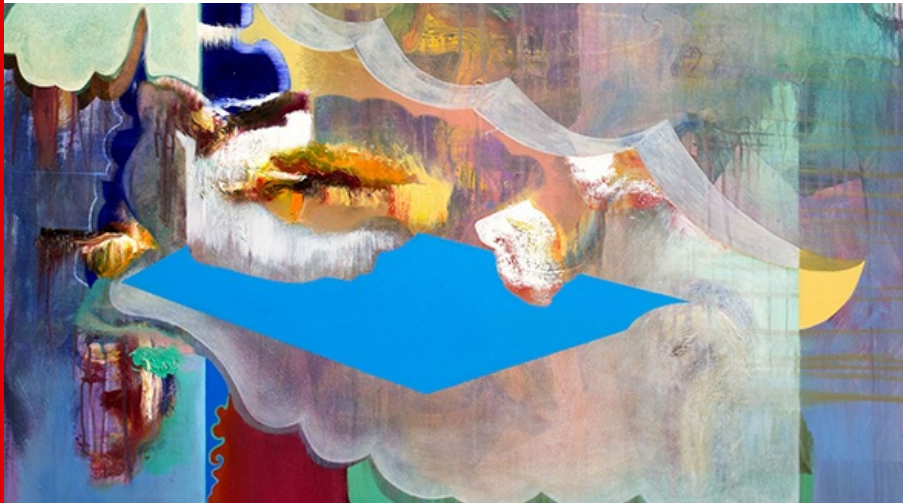
Abb.: Christina Baumann, Fosko, 2020, Öl und Acryl auf Leinwand (Ausschnitt)