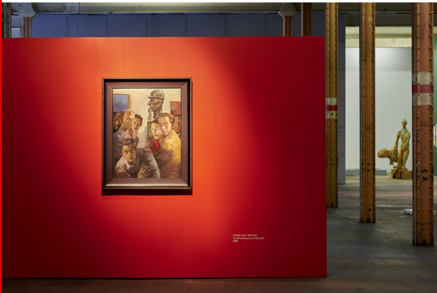
Abb.: Blick in die Ausstellung, Foto: HALLE 14 | Walther Le Kon, 2020