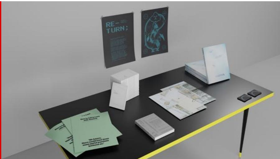
Abb.: Neuerscheinungen bei Edizione Multicolore, Foto: Edizione Multicolore, 2021