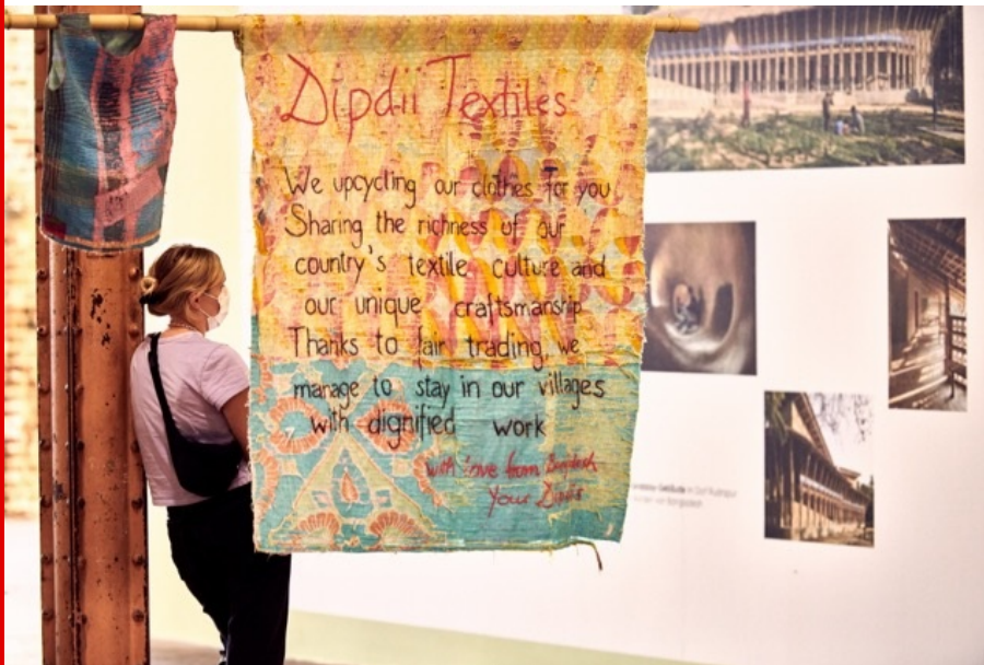
Abb.: Ausstellungsansicht der Beiträge v on Anna Heringer & Dipdii Textiles, Foto: HALLE 14 | Walther Le Kon, 2021.