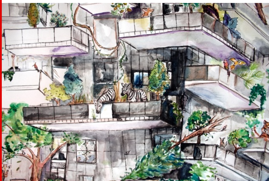
Abb.: Edna Gee, The Vertical Jungle: The Rebellion of Nature (Detail), 2016.