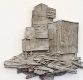
Abb.: Werkansicht v on Wibke Rahn, Foto: VG Bild-Kunst | Wibke Rahn Wibke Rahn, 2021.