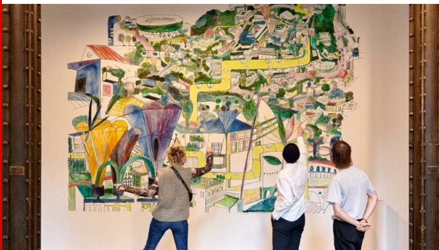
Abb.: Kerstin Rupp, Wandgemälde des zukünftigen Leipzigs in der HALLE 14, Foto: HALLE 14 | Walther Le Kon, 2021.