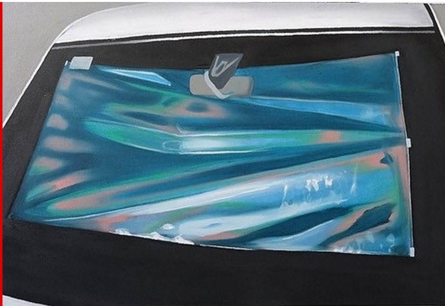
Abb.: Johannes Unger, Reflexion (Ausschnitt), Öl auf Leinwand, 200 x 160 cm, 2021.