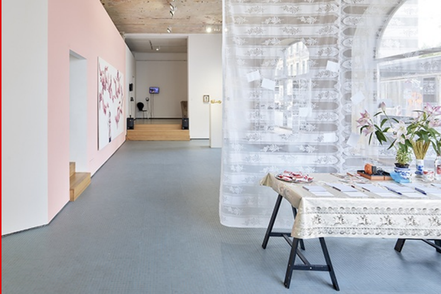
Abb.: Blick in die Ausstellung „Where is my karaoke? Still, we sing“, 2022.