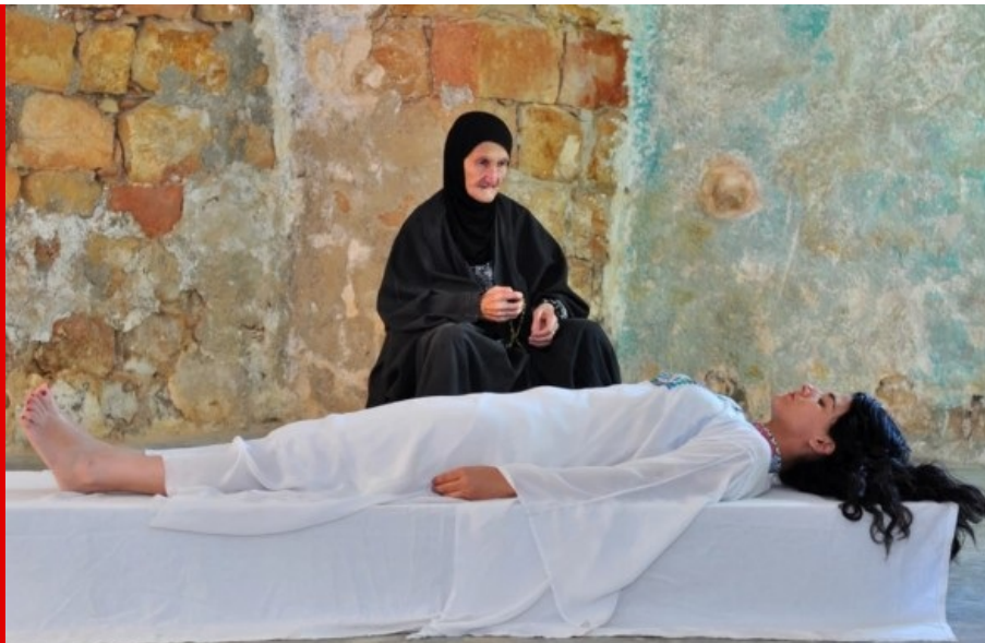
Abb.: Nasrin Abu Baker, A Feminine Name, Videoarbeit (Still), 2013.