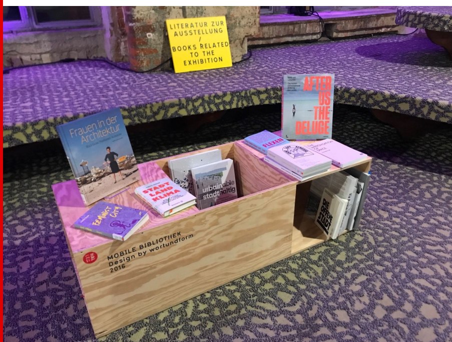
Abb.: Ein Teil der Bücher zur Ausstellung im Besucherzentrum, Foto: HALLE 14, 2021.