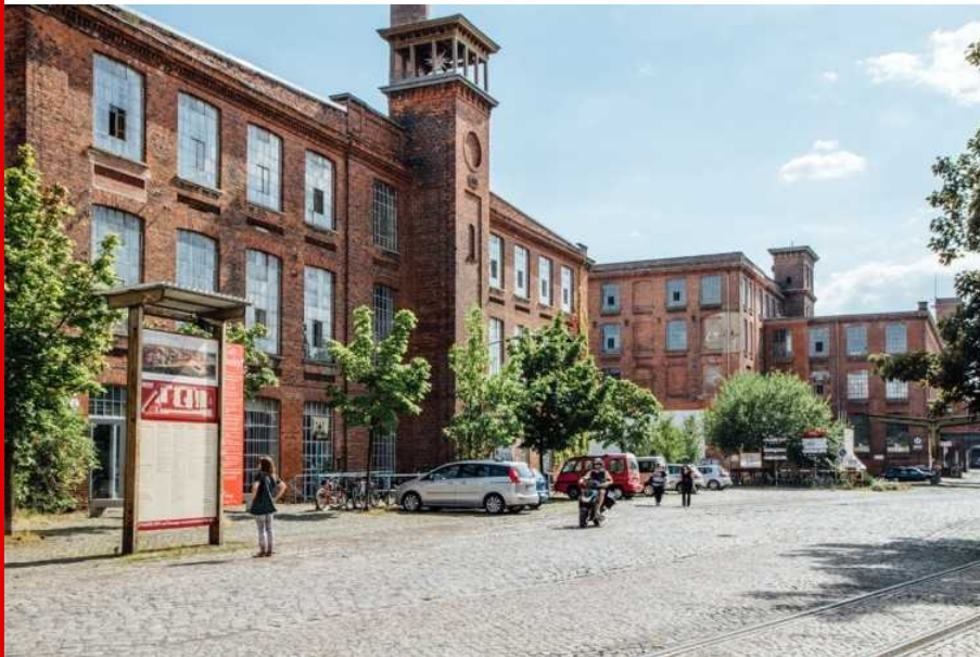
Abb.: Leipziger Baumwollspinnerei, Foto: Uwe Walter, 2014