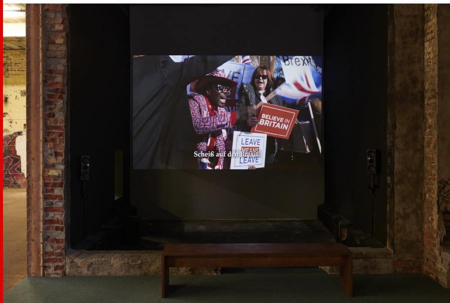
Abb.: Jeremy Deller, Putin's Happy, Video, 2019, Foto: Walther Le Kon | HALLE 14, 2020