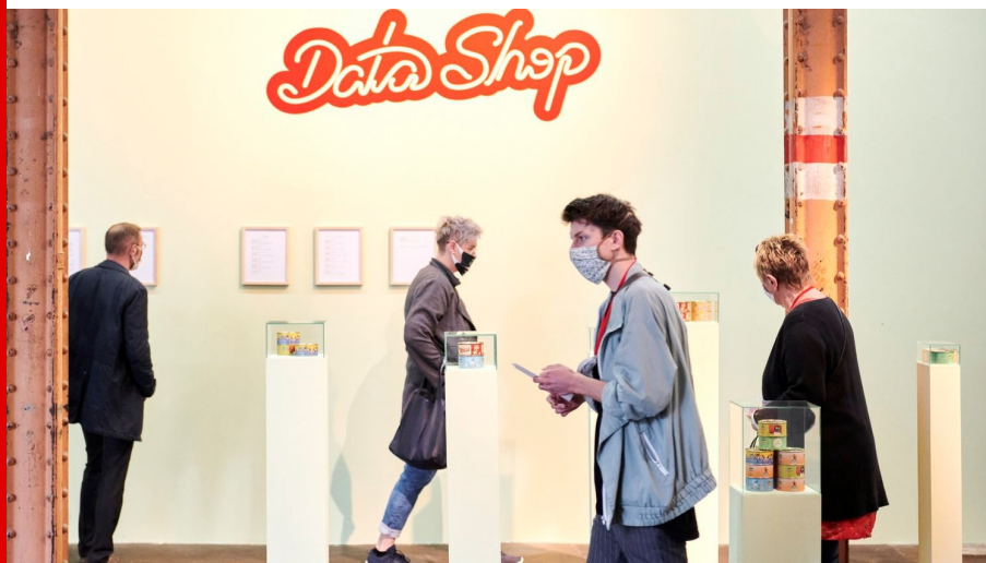
Abb.: Varvara & Mar, Data Shop, 2018 | HALLE 14, 2020